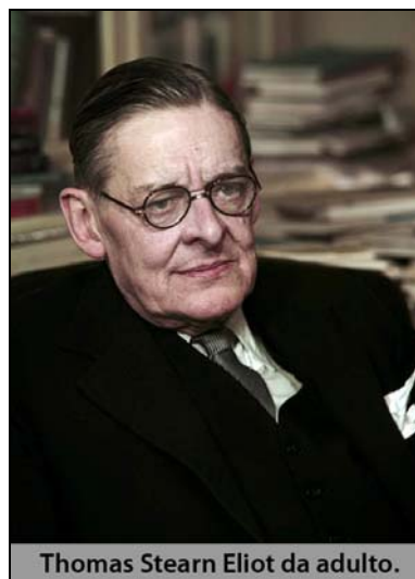
Thomas Stearn Eliot da adulto.

Thomas Stearns Eliot, Nobel per la letteratura nel 1948 con la motivazione " for his outstanding, pioneer contribution to present-day poetry ", è considerato, nel panorama della letteratura mondiale, uno tra i massimi poeti del Novecento e non solo.