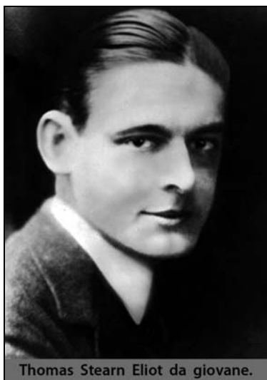
Thomas Stearn Eliot da giovane.